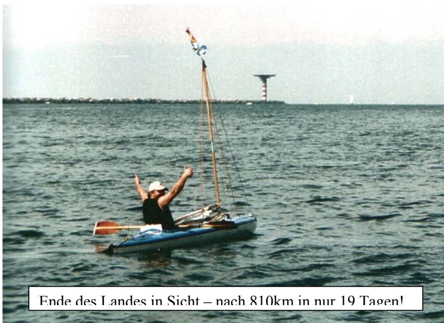
Ende des Landes in Sicht – nach 810km in nur 19 Tagen!