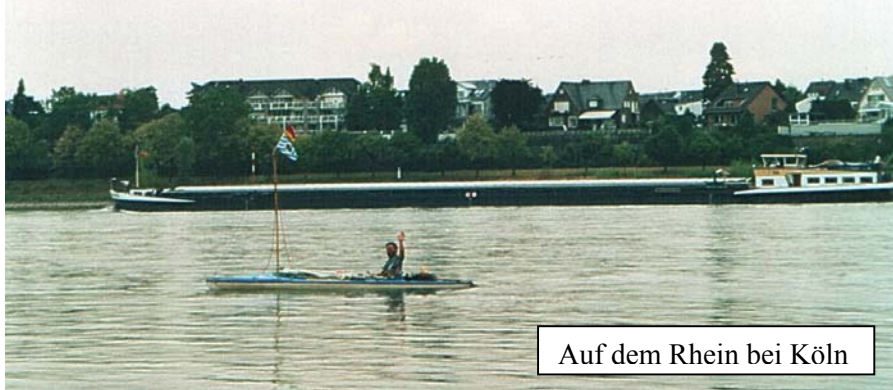
Auf dem Rhein bei Köln