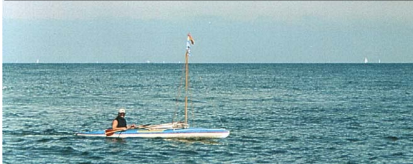
Auf dem Meer vor der Rheinmündung bei Hoek van Holland