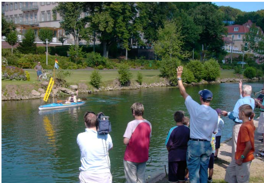
Abfahrt Bad Kissingen am 13.07.2003 – mit TV und ca. 50 Freunden